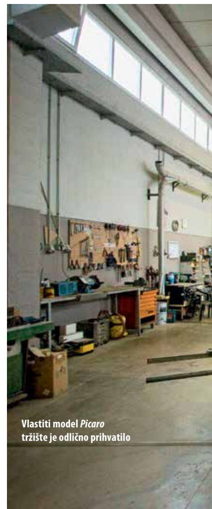
Vlastiti model Picaro tržište je odlično prihvatilo